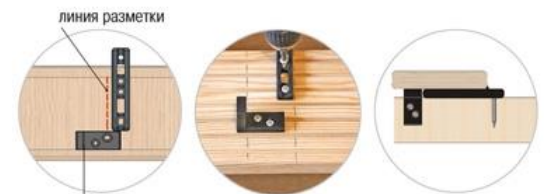
Вариант 2 – БОКОВОЕ крепление стартового крепежа