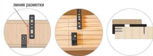
Вариант 1 – ТОРЦЕВОЕ крепление стартового крепежа